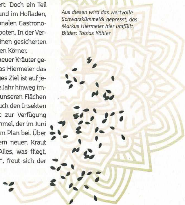
Aus diesen wird das wertvolle Schwarzkümmelöl gepresst, das Markus Hiermeier hier umfüllt.